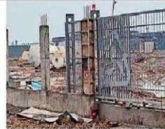
यमुनानगर। मेसर्स एसबीएस बायो गैस प्रा. लि. दामला में जमा की गई शुगर मली।

प्रदूषण विभाग के अधिकारियों ने अपनी जांच रिपोर्ट में बताया है कि प्रेम मड बायोडिजेकल प्रोडक्ट है। इसे निश्चित समय में डिस्कनेक्ट करना होगा। इसका निस्तारा न कर, अवैधानिक तरीके से खुले में रखा है। मैके पर पॉल्यूशन निर्वहण के लिए कोई उपाय नहीं किए हैं। इससे एयर पॉल्यूशन कई गुना बढ़ जाएगा। इसका अंतर फैक्ट्री के 3 किमी से अधिक के एरिया में रह सकता है। वहीं, इससे भूमिगत जल को भी प्रदूषित होगा। इसीलिए फैक्ट्री को सेक्टर 3 एर एर, 33ए बटर एर 1984 के तहत बंद करने का निर्णय दिया गया। साथ ही पॉल्यूशन कंट्रोल बोर्ड यमुनानगर के अधिकारियों से कहा गया कि वे प्लॉट, पर्सोनेली व डीजे सेट को बंद करें। बिजली को सक्वाई कट दी जाए।