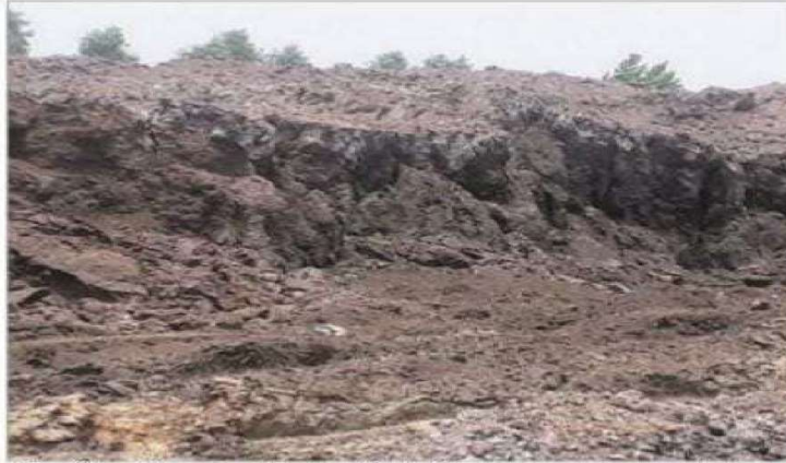
The site of the closed industrial unit.